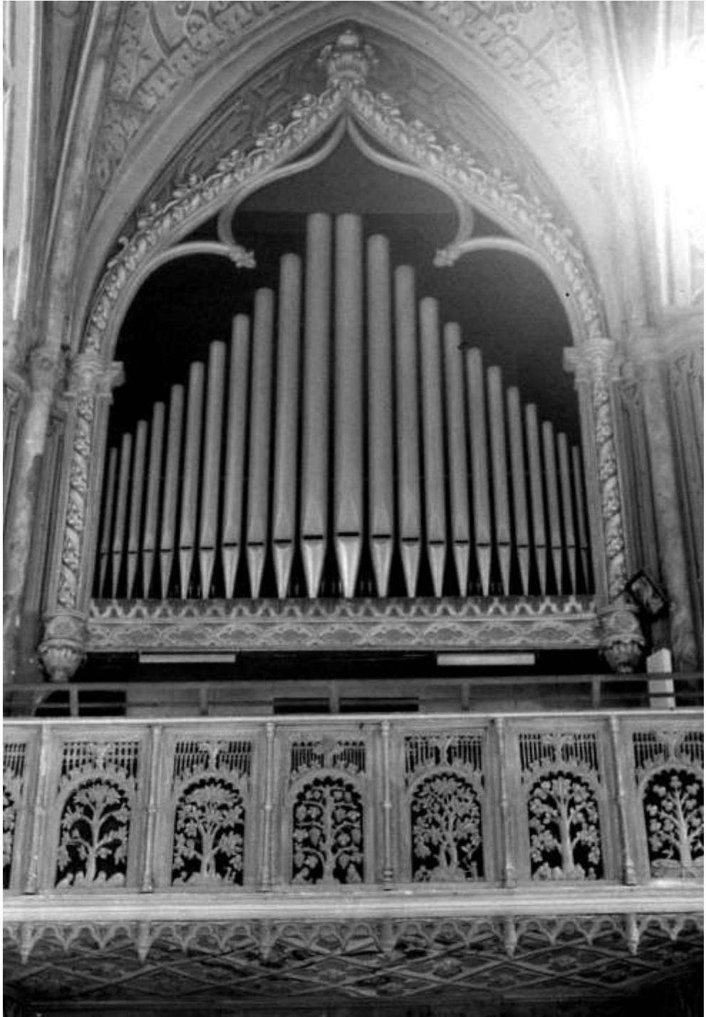
Cattedrale di Biella organo di Camillo Guglielmo Bianchi, 1860