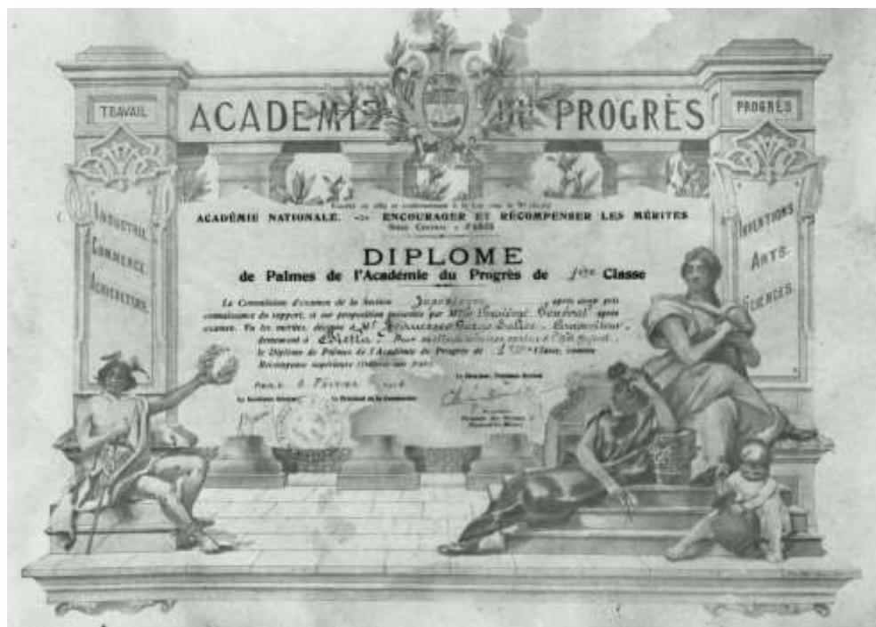
Diploma dell'Academie du Progrès Parigi, 6 febbraio 1924

L'impegno successivo dà l'idea di un avvicinamento sempre maggiore del Gurgo alle manifestazioni ufficiali. Infatti, nella primavera dell'anno successivo unisce le sue formazioni, che nel frattempo vengono semplicemente indicate come «Società Orchestrale e Corale», in un concerto di beneficenza per la Casa del Fanciullo. 154