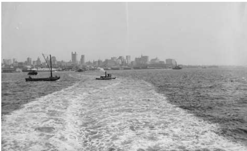
Il porto di New York dal traghetto per Hoboken