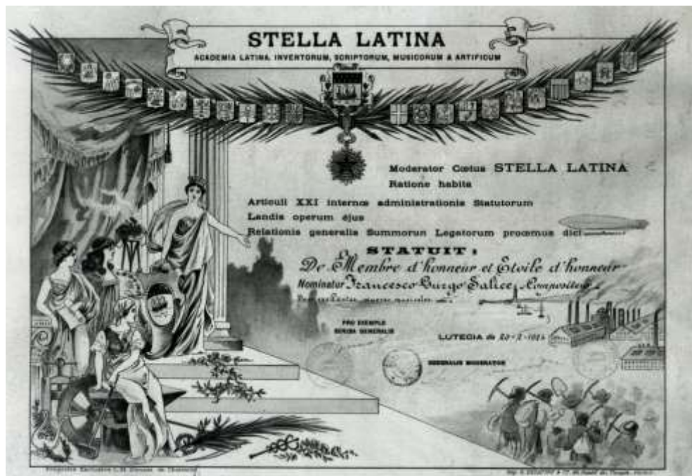
Diploma dell'Academia Latina inventorum, scriptorum, musicorum & artificum Parigi, 20 febbraio 1924

Di questi attestati resta traccia documentale. Il «Diplome de Palmes de l'Académie du Progrès de 1 ère classe» è assegnato al Gurgo il 6.2.1924 « pour excellents services rendus à l'Art Musical ». La «Stella Latina» della parigina Academia latina, inventorum, scriptorum, musicorum & artificum reca invece la data del 20.2.1924; il riconoscimento cita « Membre d'honneur et Étoile d'honneur [...] pour excellentes œuvres musicales ».