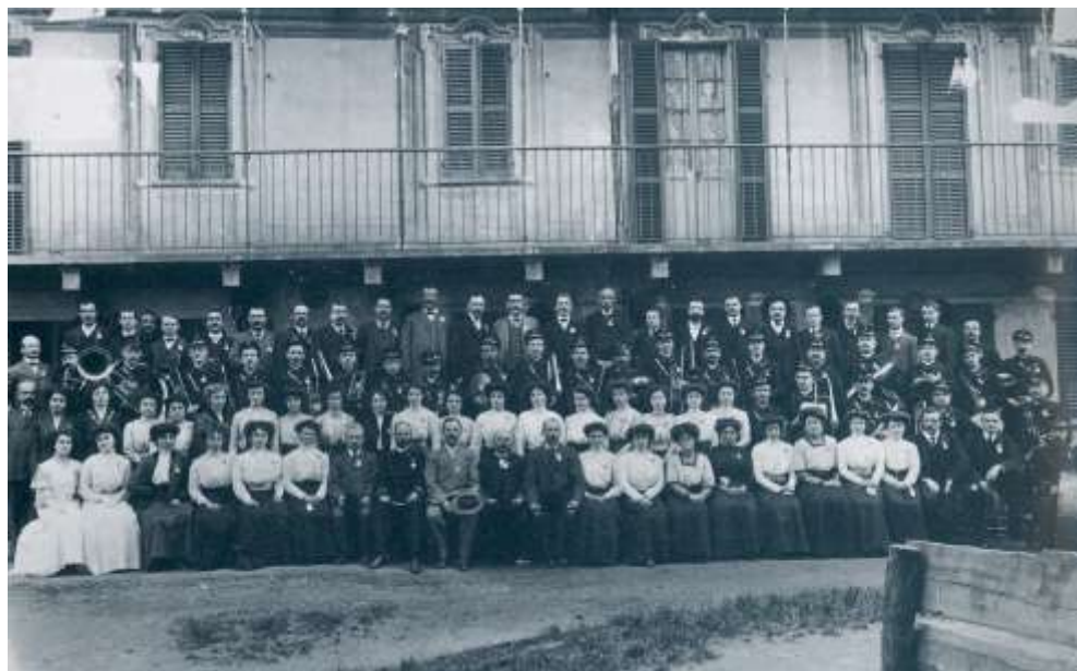
La Società Musicale Cattolica di Sagliano Micca: (1910, collezione privata)

Nello stesso anno e nel successivo la Banda continua a prestare servizio nelle circostanze più disparate.