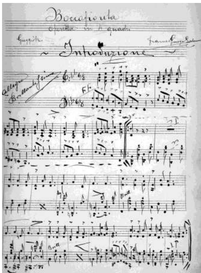
Prima pagina dell'Introduzione di Roccafiorta (1910, collezione privata)

«è noto che il maestro Gurgo, rifuggendo dai convenzionalismi dell'arte, suole ricercare l'effetto musicale in un campo più difficile e poco battuto». 104 È per tali ragioni che la Compagnia Teatrale Silvio Pellico di Sagliano Micca e i Filodrammatici di San Cassiano di Biella sono costretti inizialmente a rinunciare alla rappresentazione per lasciar "maturare" il tutto. Le compagnie riprendono in mano il testo e lo spartito all'inizio del 1911 e, finalmente, il giorno di Natale, vanno in scena in forma semi-privata con una seconda versione dal titolo Un tiro birbone . 105 Evidentemente sempre a causa delle difficoltà incontrate, per il grande pubblico si replica solo il 29 dicembre 1912.