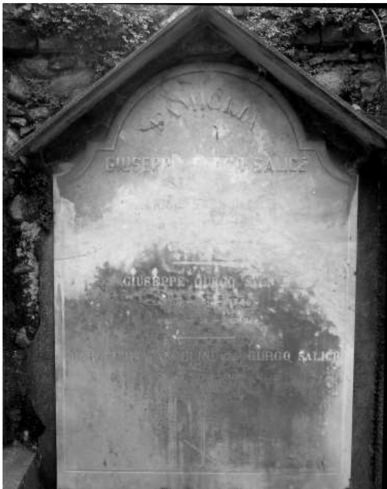
Cimitero di Biella tomba della famiglia di Giuseppe Gurgo Salice

E sulla via riformistica imboccata dal can. Basilio Buscaglia non vi sono più ostacoli. Anzi, a questi si unisce, a pieno titolo e non più come “consulente”, Pietro Magri che in quell’epoca trasferisce residenza e convinzioni alla Metropolitana di Vercelli, frequentando regolarmente il Santuario d’Oropa, di cui diventerà organista nel 1920.