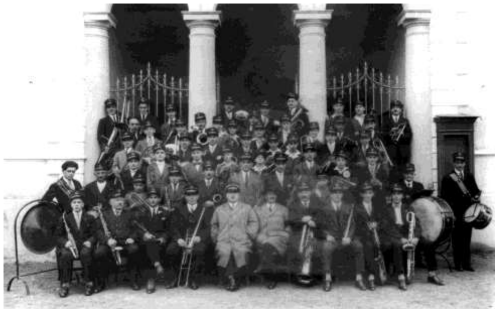
Il Club Concerto Verdi di Pettinengo