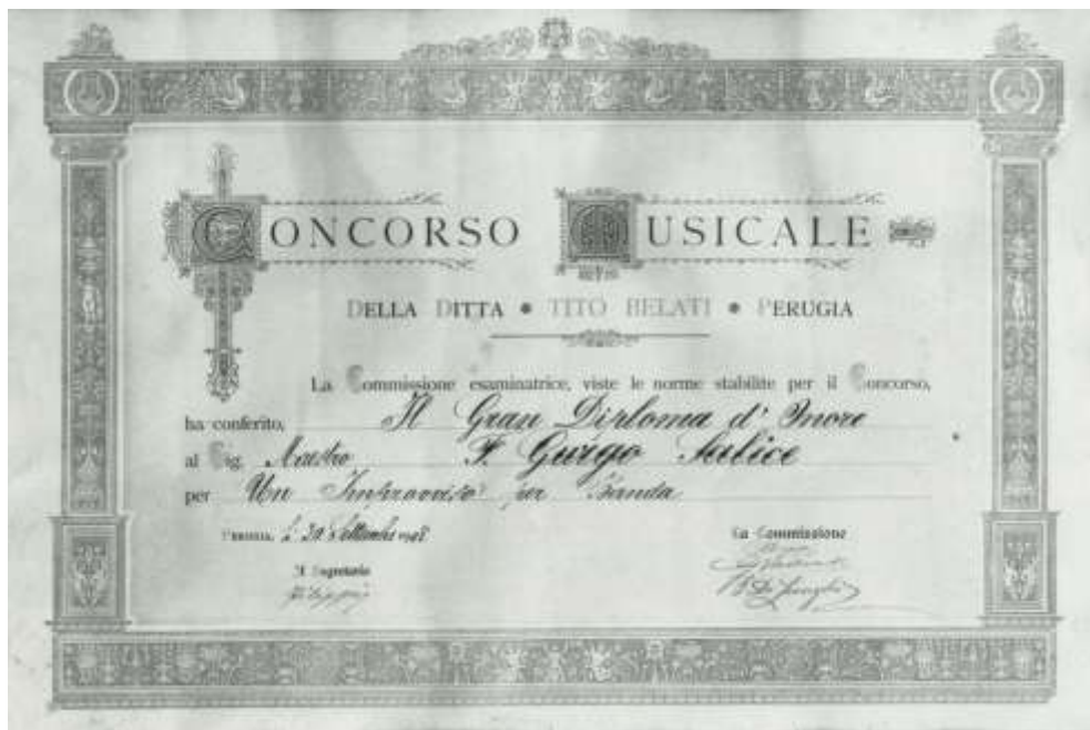
Il Gran Diploma d'Onore del Concorso Musicale bandistico Perugia, 30 settembre 1908

3. Marcia dei giganti ; 4. Scherzo ; 5. Improvviso ; 6. Valse Caprice . 169 Il n. 5 è probabilmente lo spunto per la composizione vincitrice di Perugia.